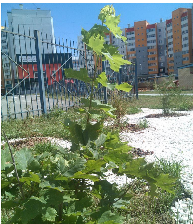
2016 год, наш клен уже подрос.