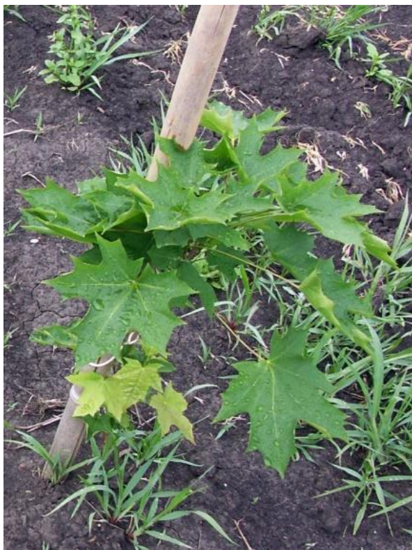
2015 год, нашему саженцу 1 год.